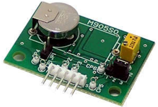
※센서는 본 Module에 포함되지 않습니다.

*3 CO가스 농도와 출력전압의 관계 (檢量線 : 분석 곡선)에 대해서는, 참고 Data로서 제출할 수도 있습니다. 필요한 경우 주문시에 요청해주시기 바랍니다.